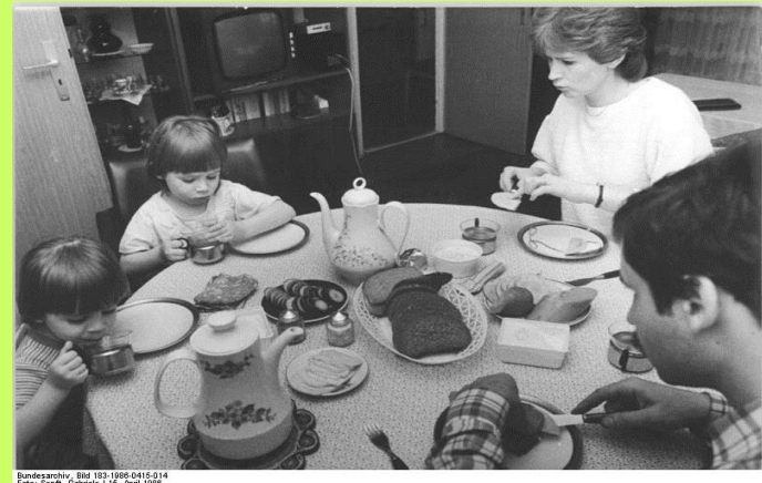
1 1/2. April 1986

http://commons.wikimedia.org/wiki/File:Bundesarchiv_Bild_183-1986-0415-014,_Berlin,_Familienszene.jpg , Senft, Gabriele , BY - SA